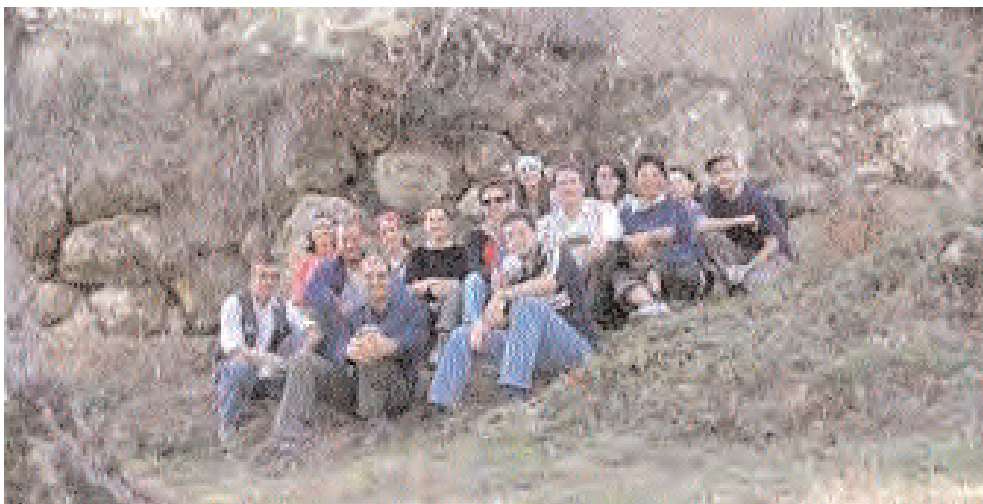
Il gruppo di ricognitori davanti al muro in opera pseudo-poligonale riconosciuto nell'ultima campagna di ricognizione