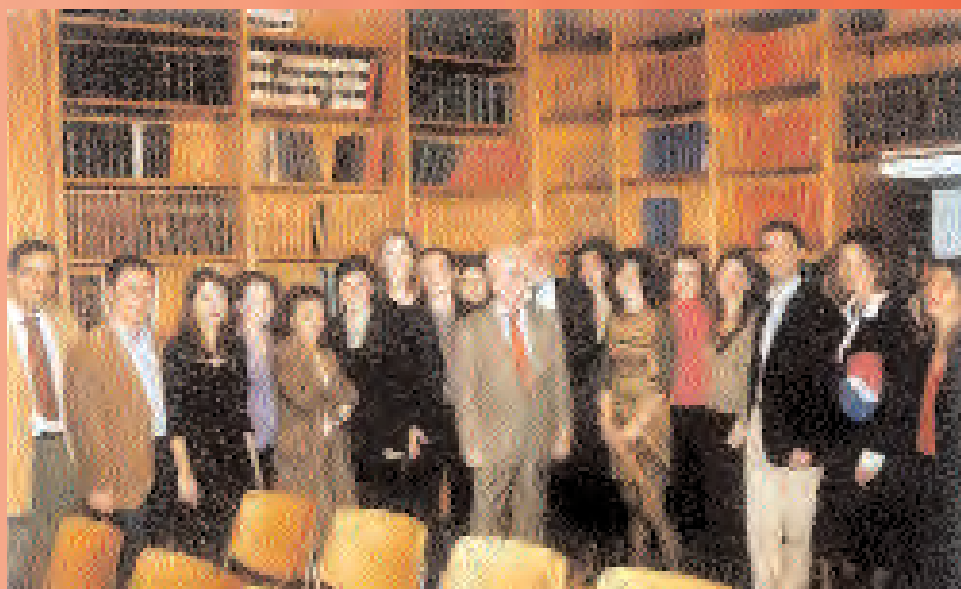
S.E. l'Ambasciatore ed il Direttore con gli allievi SAIA